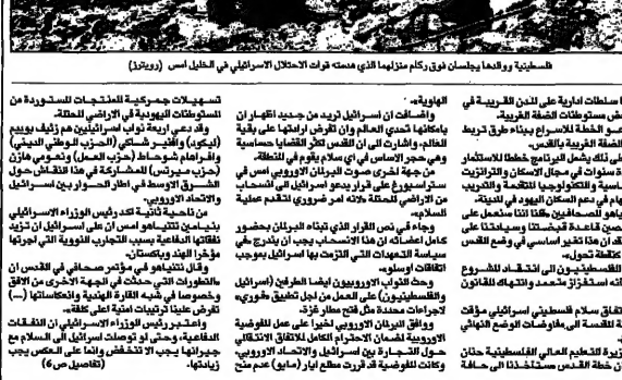
مظاهرات في صفوف المحتل الاسرائيلي في العليل اس (ريوتات)